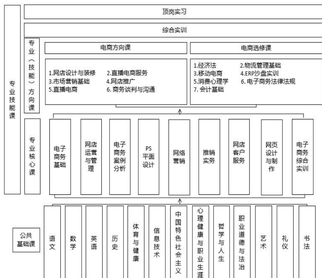
图 6-1 专业课程体系结构图

实习实训课： 本专业学生职业技能和职业岗位工作能力培养的重要实践教学环节，按教育部相关要求，保证学生顶岗实习的岗位与其所学专面向的岗位群基本一致。在确保学生实习总量的前提下，通过校企合作，实行工学交替实习